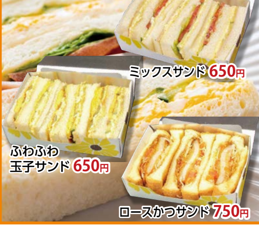
ミックスサンド 650円