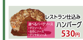
レストラン仕込みハンバーグ 530円