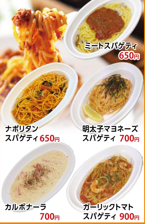
ミートスパゲティ 650円