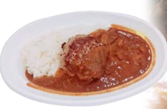
ハンバーグカレー 830円