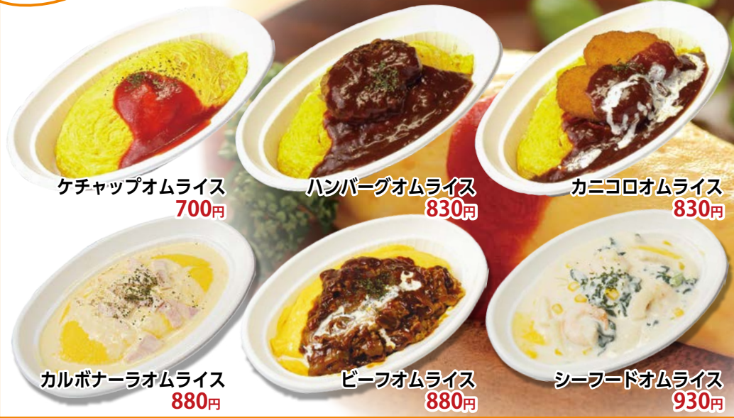
ケチャップオムライス 700円