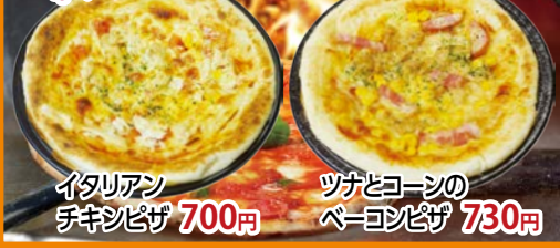
イタリアン チキシピザ 700円