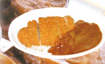
ロースかつカレー 980円