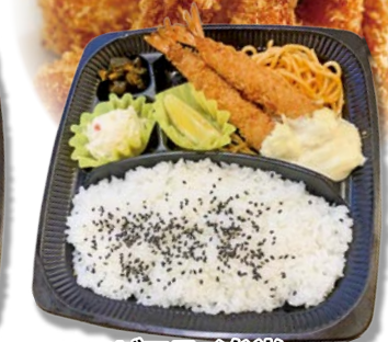
エビフライ弁当 (2本入り) 980円