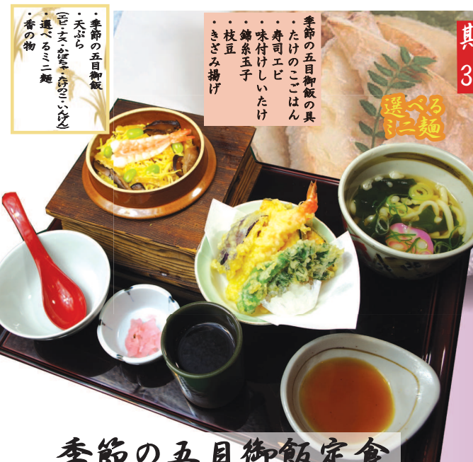
季節の五目御飯定食 1,380円(税込1,518円)