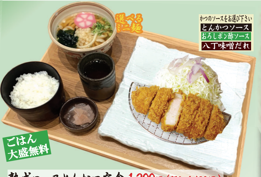
熟成ロースとんかつ定食 1,300円(税込1,430円)