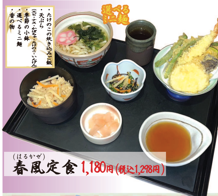
春風定食 1,180円(税込1,298円)