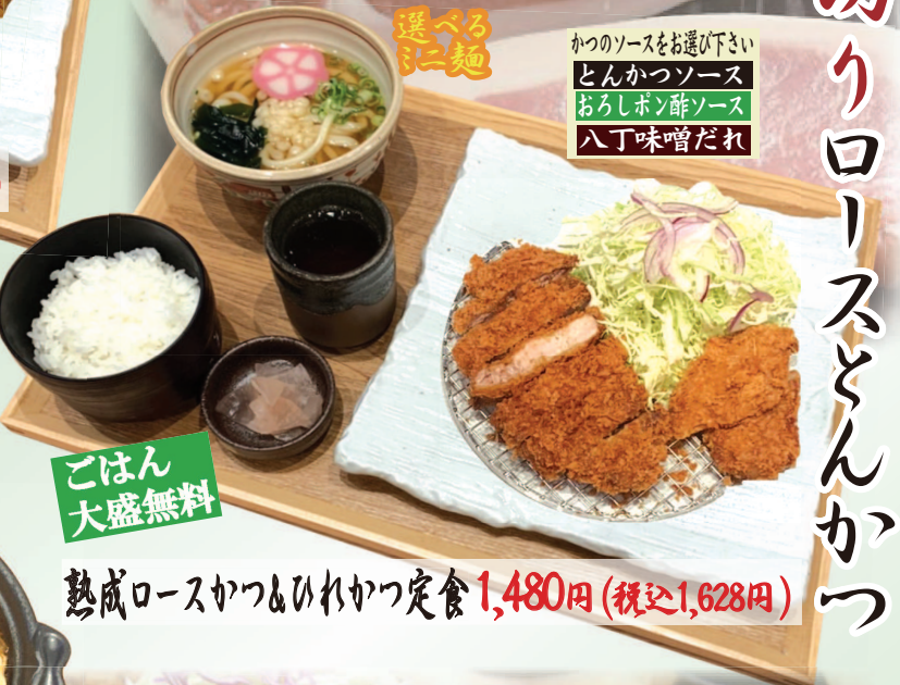
熟成ロースかつ&ひれかつ定食 1,480円(税込1,628円)

少々お時間いただきます。 食べごたえのある熟成とんかつを ご注文いただいてから丁寧に揚げています。 他のメニューに比べてお時間をいただきます。