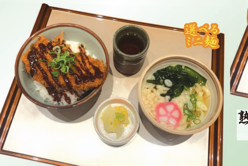
熟成味噌ロースかつ丼定食 1,280円(税込1,408円) 熟成味噌ロースかつ丼単品 1,130円(税込1,243円)