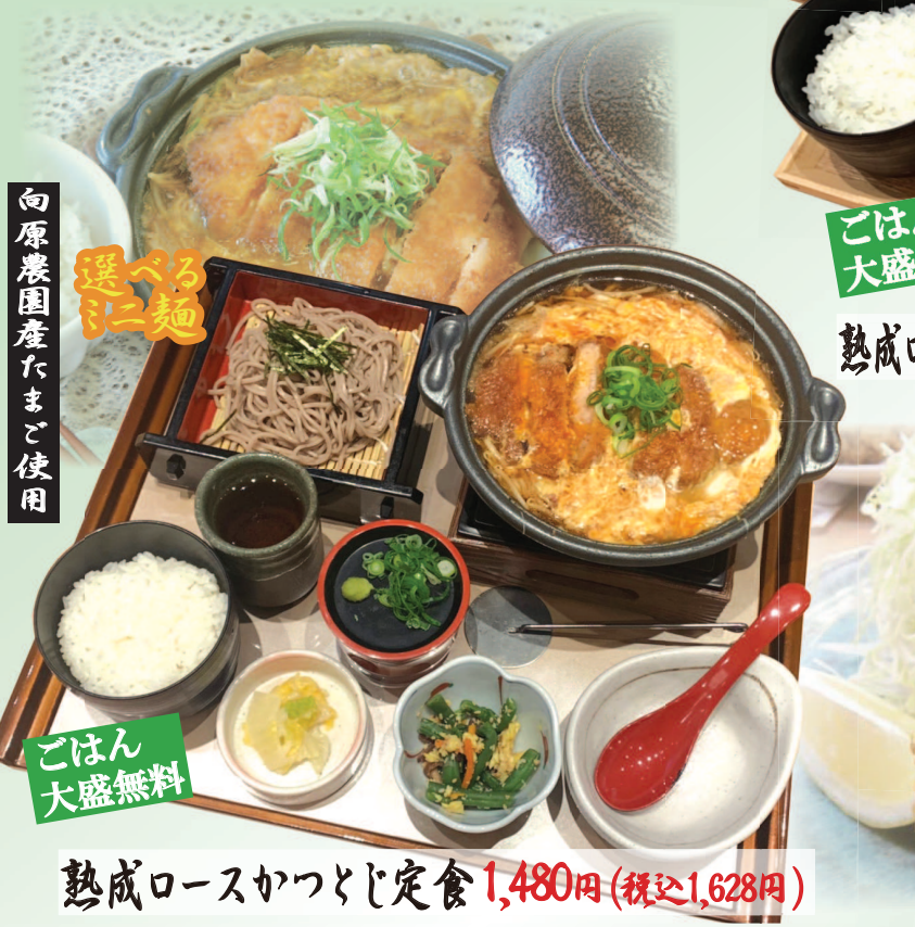
熟成ロースかつとじ定食 1,480円(税込1,628円)