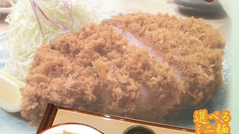
熟成ロースかつ丼定食 1,280円(税込1,408円) 熟成ロースかつ丼単品 1,130円(税込1,243円)