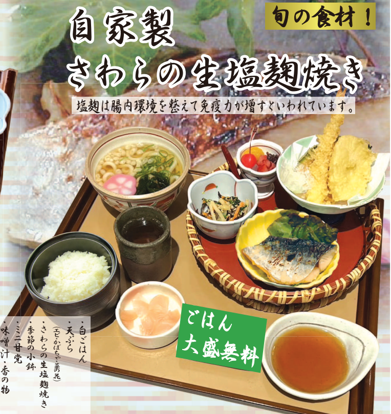
春の旬彩和膳 1,380円(税込1,518円)