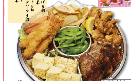
オードブル容器サイズ 4人前・直径31.5cm 4人前 4,000円