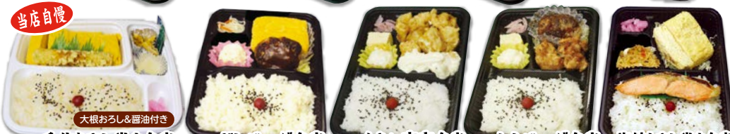
大根おろし&醤油付き 手作り出し巻き弁当 750円 だしバーグ弁当 780円 チキン南蛮弁当 780円 からバーグ弁当 780円 塩鮭と出し巻き弁当 830円