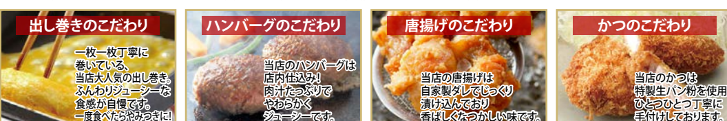
出し巻きのこだわり 一枚一枚丁寧に巻いている。当店の大人気の出し巻き。ふんわりジュシーな食感が自慢です。一度食べたら忘れません! ハンバーグのこだわり 当店のハンバーグは店内仕込み!肉汁たっぷりやわらかくジュシーです。 唐揚げのこだわり 当店の唐揚げは自家製タレでじっくり漬けており、香ばしくかつおいしい味です。 かつのこだわり 当店のかつは特製生パン粉を使用。ひとつひとつ丁寧に手付けしております。