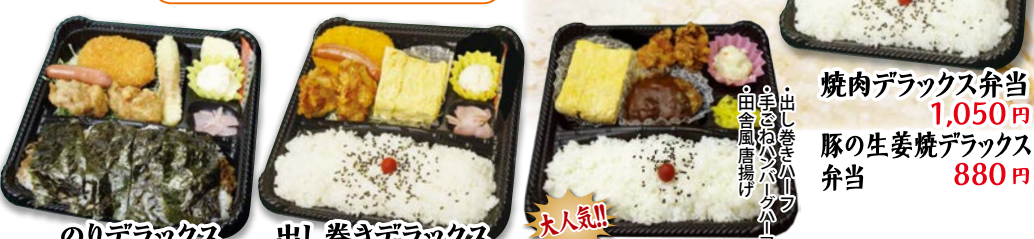
のりデラックス弁当 850円 出し巻きデラックス弁当 880円 三ツ星弁当 950円 焼肉デラックス弁当 1,050円 豚の生姜焼デラックス弁当 880円 手ごねハンバーグ 田舎風揚げ