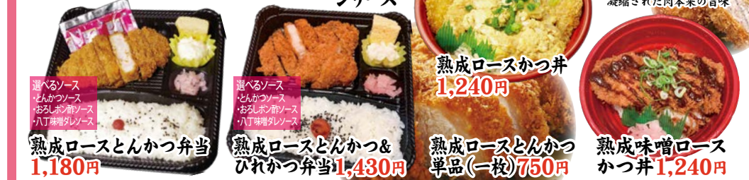
熟成ロースとんかつ弁当 1,180円 熟成ロースとんかつ & ひれかつ弁当 1,430円 熟成ロースかつ丼 1,240円 熟成味噌ロースかつ丼 1,240円

当店はより安全で美味しく召し上がって頂く為に御注文頂いてから調理するオーダーキッチンシステムを採用しています。その為メニューによっては、多少お待ち願う場合がございますが御了承下さい。 ◎保存料を使用しておりませんのでお早めにお召し上がり下さい。(2時間以内にはお召し上がり下さい) ◎すぐにお召し上がりいただけない場合は、高温多湿を避け涼しい場所か冷蔵庫等で保管して下さい。 ◎副菜は季節により変更する場合があります、写真と異なる場合がございますが御座います。ご了承下さい。 ◎イベント等の大量注文等に関しては仕入の都合により1週間前迄に御注文下さい。(配達承ります) ◎会社給食等、会社様への配達サービスも承っております。 ◎野外行事の雨天によるキャンセルは事前にお電話にて御相談させていただきます。 ◎ゴミの回収及び引き取りは致しておりません。但し、状況により要相談(別途料金) ◎ご予約のお客様にはお茶(有料)のご用意もできますので、ご予約時にご相談ください。