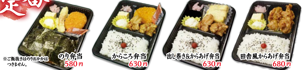
※ご飯抜きはのりおかかはつきません。 のり弁当 580円 からころ弁当 630円 出し巻き&からあげ弁当 630円 田舎風からあげ弁当 680円