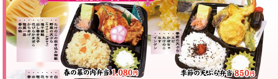
春の幕の内弁当 1,080円 季節の天ぷら弁当 850円