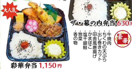
大人気 彩華弁当 1,150円 ザ・幕の内弁当 630円 ミニハンバーグ ちくわの天ぷら 出し巻きカット ポテトサラダ 惣菜 かまぼこ 香の物 牛焼肉 ちくわの天ぷら 出し巻きカット 田舎風揚げ かまぼこ 塩干銀鮭 惣菜 香の物