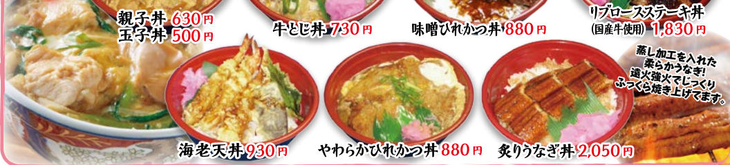
親子丼 630円 玉子丼 500円 牛とじ丼 730円 味噌ひれかつ丼 880円 ハT味噌だれ リブソースステーキ丼 (国産牛使用) 1,830円 蒸し加工を入れた柔らかなきり鶏火でじっくりふつふつ焼き上げます。 海老天丼 930円 やわらかひれかつ丼 880円 炙りうなぎ丼 2,050円