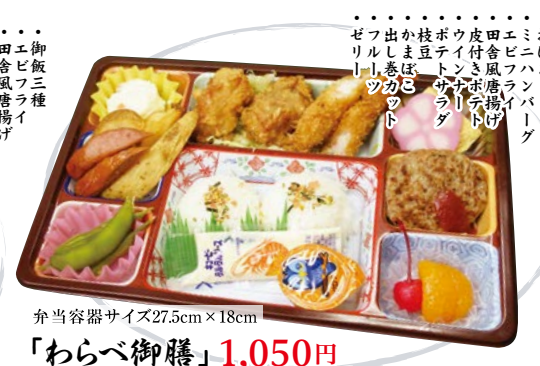
弁当容器サイズ27.5cm×18cm 「わらべ御膳」1,050円