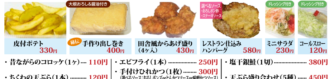
大根おろし&醤油付き 皮付ポテト 330円 手ごねハンバーグ 400円 田舎風からあげ盛り (4ヶ入) 430円 レストラン仕込みハンバーグ 580円 ミニサラダ 230円 コールスロー 120円 選べるソース おろしホシ酢 ステーキソース ドレッシング付き ドレッシング付き ・昔ながらのコロッケ(1ヶ) 110円 ・ちくわの天ぷら(1本) 120円 ・エビフライ(1本) 250円 ・手付けひれかつ(1枚) 300円 (選べるソース:おろしホシ酢orとんかつソースor味噌かつソース) ・塩干銀鮭(1切) 380円 ・天ぷら盛り合わせ(5種) 450円