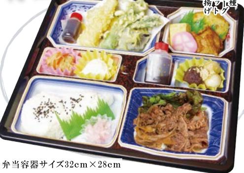
弁当容器サイズ32cm×28cm 特撰花満円懐石「やわらぎ」2,200円