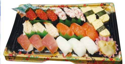
「ファミリーにぎり寿司セット」(3人前) 2,800円 【まぐろ・イカ・エビ・玉子・サーモン・イクラ・かに(草織)】