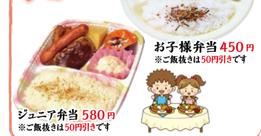
お子様弁当 450円 ※ご飯抜きは50円引きです ジュニア弁当 580円 ※ご飯抜きは50円引きです