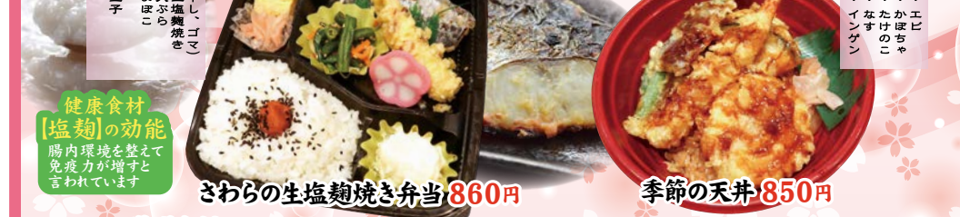
さわらの生塩麴焼き弁当 860円 季節の天井 850円