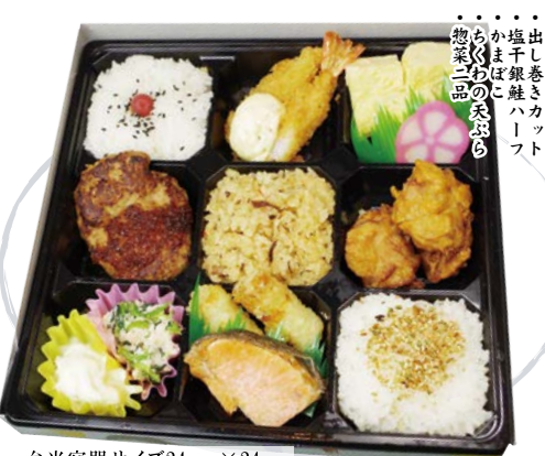
弁当容器サイズ24cm×24cm 「まつり弁当」1,650円