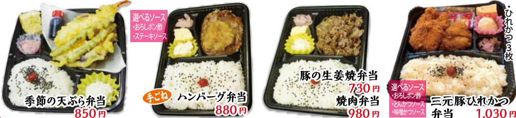
季節の天ぷら弁当 850円 選べるソース おろしホシ酢 ステーキソース 手ごねハンバーグ弁当 880円 豚の生姜焼弁当 730円 焼肉弁当 980円 三元豚ひれかつ弁当 1,030円 ・心れかつの枚