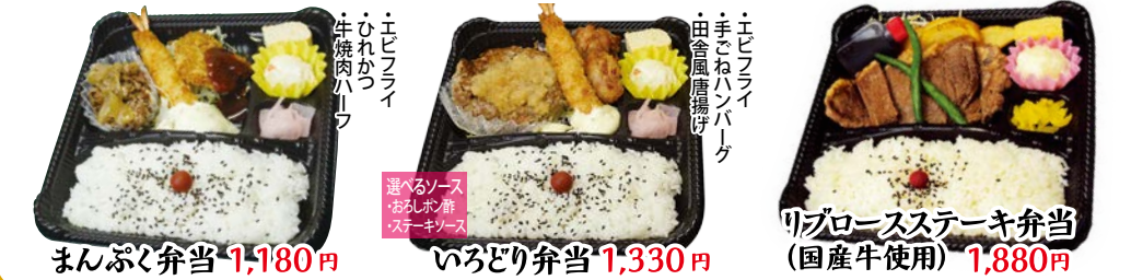
まんぷく弁当 1,180円 いろいろ弁当 1,330円 リブソースステーキ弁当 (国産牛使用) 1,880円 エビフライ 手ごねハンバーグ 田舎風揚げ エビフライ 手ごねハンバーグ 田舎風揚げ 選べるソース おろしホシ酢 ステーキソース